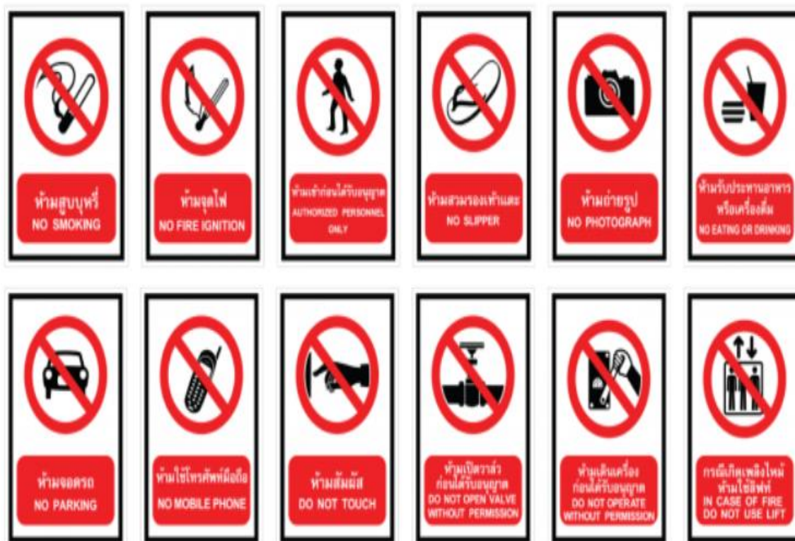
ภาพที่ 4 ป้ายห้าม