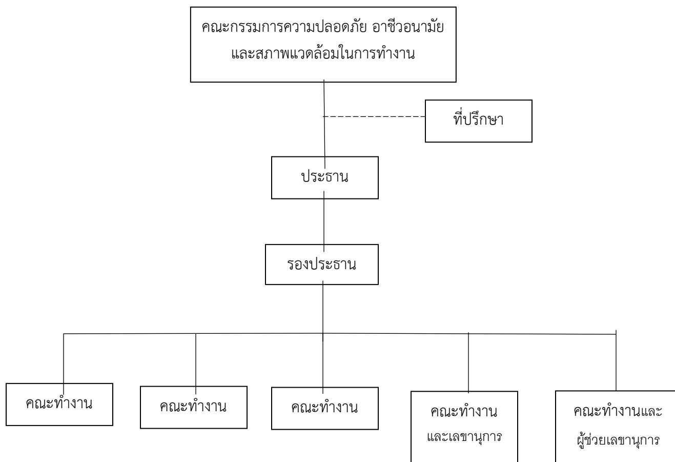
ภาพที่ 1 แผนผังการจัดตั้งหน่วยงานความปลอดภัยในการทำงาน

1.1 การจัดตั้งหน่วยงานความปลอดภัยในการทำงาน แสดงองค์ประกอบรวม ในรูปของแผนผังดังต่อไปนี้