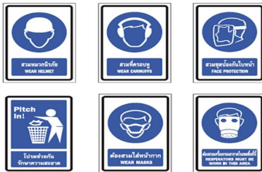
ภาพที่ 5 ป้ายเครื่องหมายบังคับ