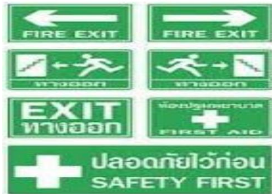
ภาพที่ 6 ป้ายแสดงสภาวะความปลอดภัย