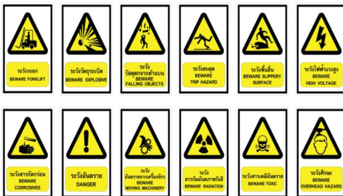
ภาพที่ 7 ป้ายเตือน