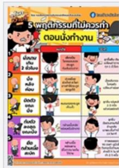
5 พฤติกรรมที่ไม่ควรทำ ตอนนั่งทำงาน