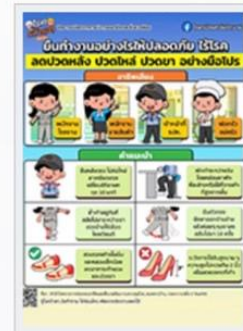
ยืนทำงานอย่างไรให้ปลอดภัย ไร้โรค