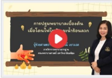
การปฐมพยาบาลเบื้องต้น เมื่อโดนไฟไหม้ และน้ำร้อนลวก