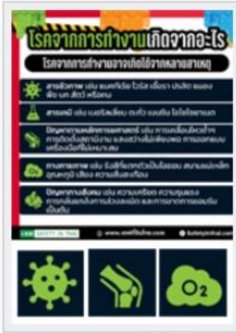
โรคจากการทำงานเกิดจากอะไร