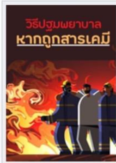
วิธีปฐมพยาบาลหากถูกสารเคมี