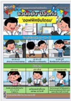
ชวนขยับ ป้องกันออฟฟิศซินโดรม