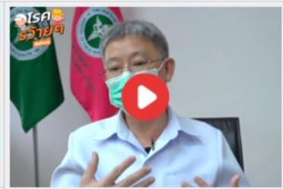
พระราชบัญญัติควบคุมโรคจากการประกอบอาชีพ และโรคจากสิ่งแวดล้อม พ.ศ.2562 (โรคร้ายๆ ร้ายๆทำงาน )