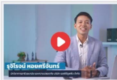
หลักการป้องกันและควบคุมโรคจากการประกอบอาชีพ ตามหลัก Hierarchy of control