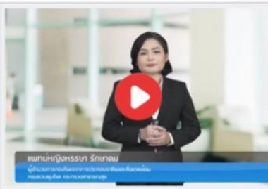
พ.ร.บ.ควบคุมโรคจากการประกอบอาชีพกับการเฝ้าระวังป้องกันควบคุมโรค (ที่มาความสำคัญ ของ พ.ร.บ. )