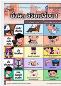
นั่งผิด ชีวิตเปลี่ยน