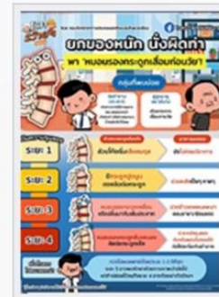
ยกของหนัก นั่งผิดท่า หมอนรองกระดูกเสื่อมก่อนวัย