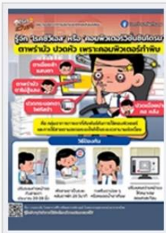
โรคซิวเอส หรือ คอมพิวเตอร์วิชั่นซินโดรม