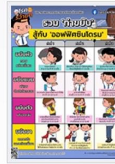
ทำขยับ สู้กับ ออฟฟิศซินโดรม