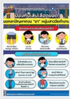
ป้องกันเส้นเลือดอุดตัน