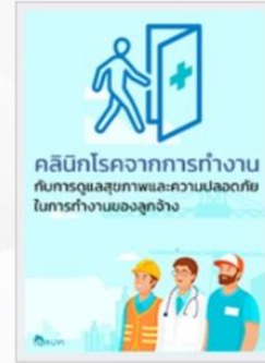
บทความ: คลินิกโรคจากการทำงานกับการดูแลสุขภาพและความปลอดภัยในการทำงานของลูกจ้าง