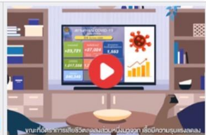
เมื่อ... โควิด19 จะกลายเป็นโรคประจำถิ่น