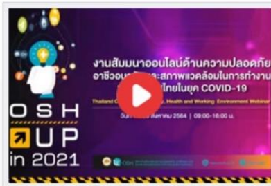
กฎหมายภายใต้ พรบ.ควบคุมโรคจากการประกอบอาชีพและโรคจากสิ่งแวดล้อม พ.ศ. 2562