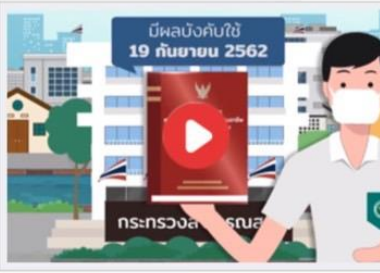
พระราชบัญญัติควบคุมโรคจากการประกอบอาชีพ และโรคจากสิ่งแวดล้อม พ.ศ. 2562