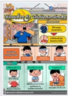
ใช้แขนซ้าย ๆ ถ้าเอ็นข้อศอกอักเสบ