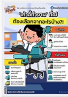
การเลือกเก้าอี้ทำงาน