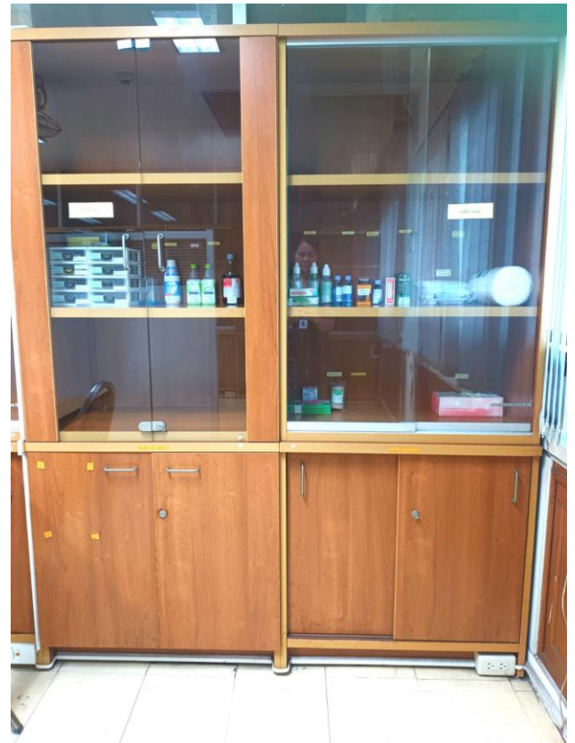
ห้องปฐมพยาบาล คณะพยาบาลศาสตร์ บางกอกน้อย