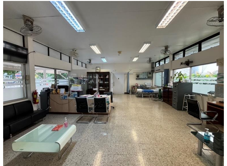
คลินิกการพยาบาลและการผดุงครรภ์ คณะพยาบาลศาสตร์ บางขุนนนท์