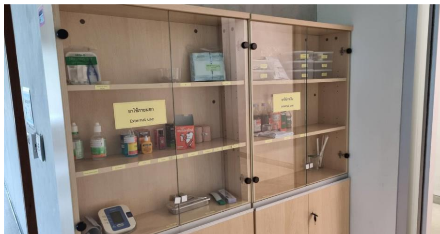
ห้องปฐมพยาบาล คณะพยาบาลศาสตร์ ศาลายา