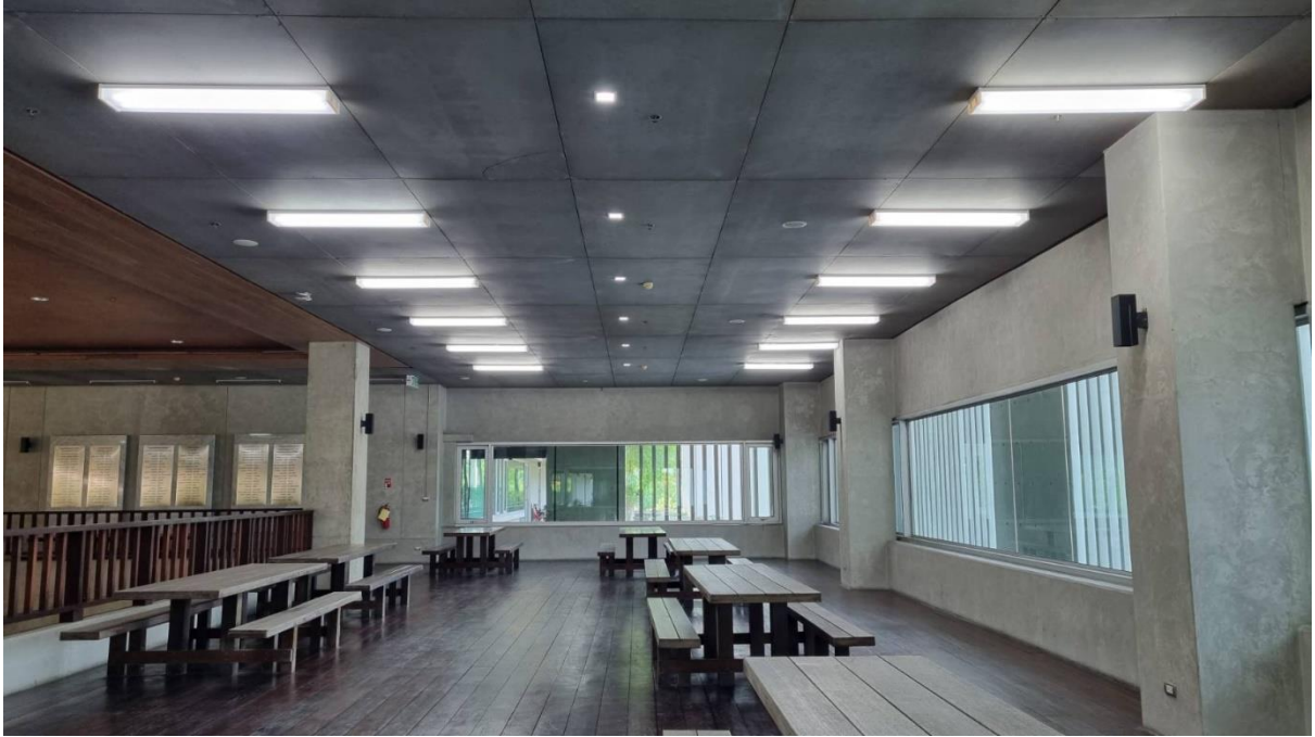
จัดพื้นที่บริเวณระเบียงในอาคารทุกชั้น มีที่นั่งจำนวนมากและเพียงพอ