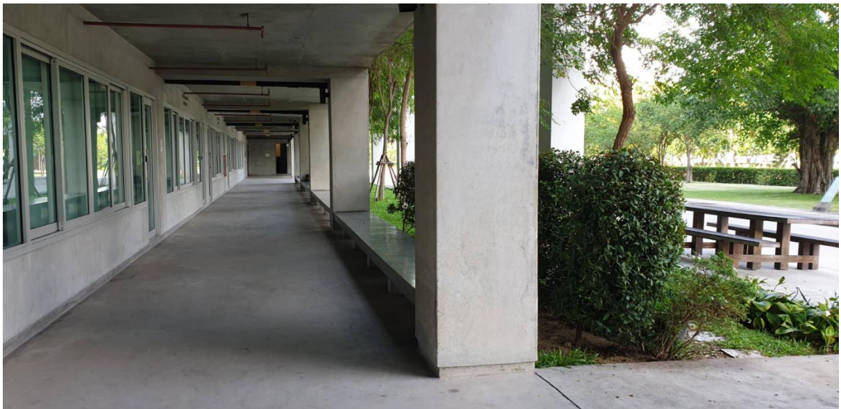
พื้นที่ทางเดินทั้งในและนอกอาคารมีแสงสว่างส่องถึง และมีไฟฟ้าสว่าง ไม่มีจุดหรือมุมอับ