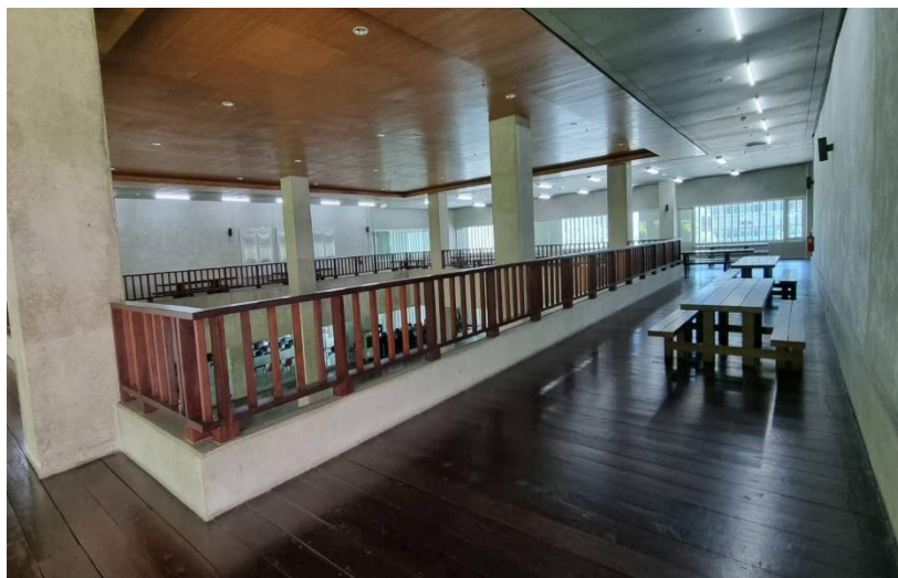
ที่นั่งพักผ່อนสำหรับนักศึษา จดัไว้ทุกลัษนของอาคาร ฦ คณะพยาบาลศาสตร์ ศาลายา