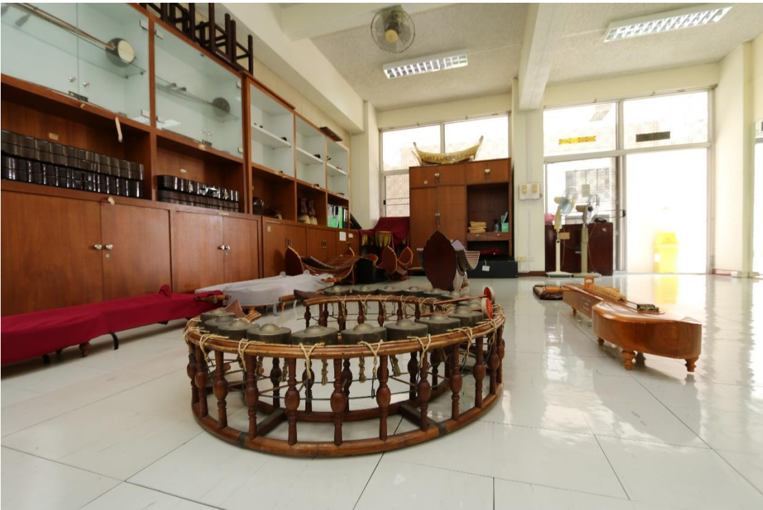
ห้องดนตรีไทยสำหรับนักศึกษา ณ หอพักคณะพยาบาลศาสตร์ บางขุนนนท์