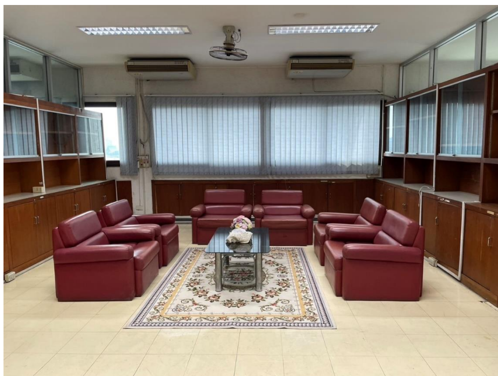
ห้องพักผ่อนสำหรับ นักศึกษา บุคลากร บุคลากรเกษียณ ณ คณะพยาบาลศาสตร์ บางกอกน้อย