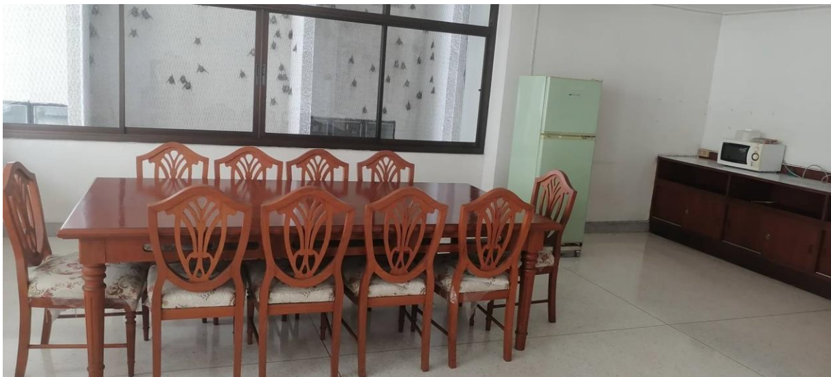
ที่นั่งพักผ่อนสำหรับนักศึกษา จัดไว้ทุกชั้นของอาคาร ณ หอพักคณะพยาบาลศาสตร์ บางขุนนนท์