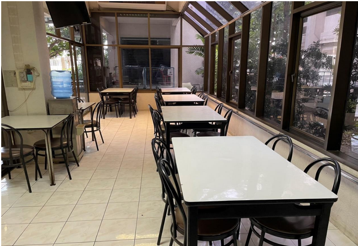
คณะพยาบาลศาสตร์ บางกอกน้อย