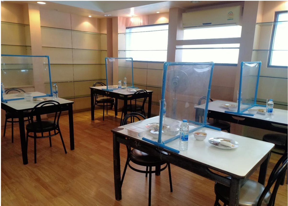
คณะพยาบาลศาสตร์ บางกอกน้อย