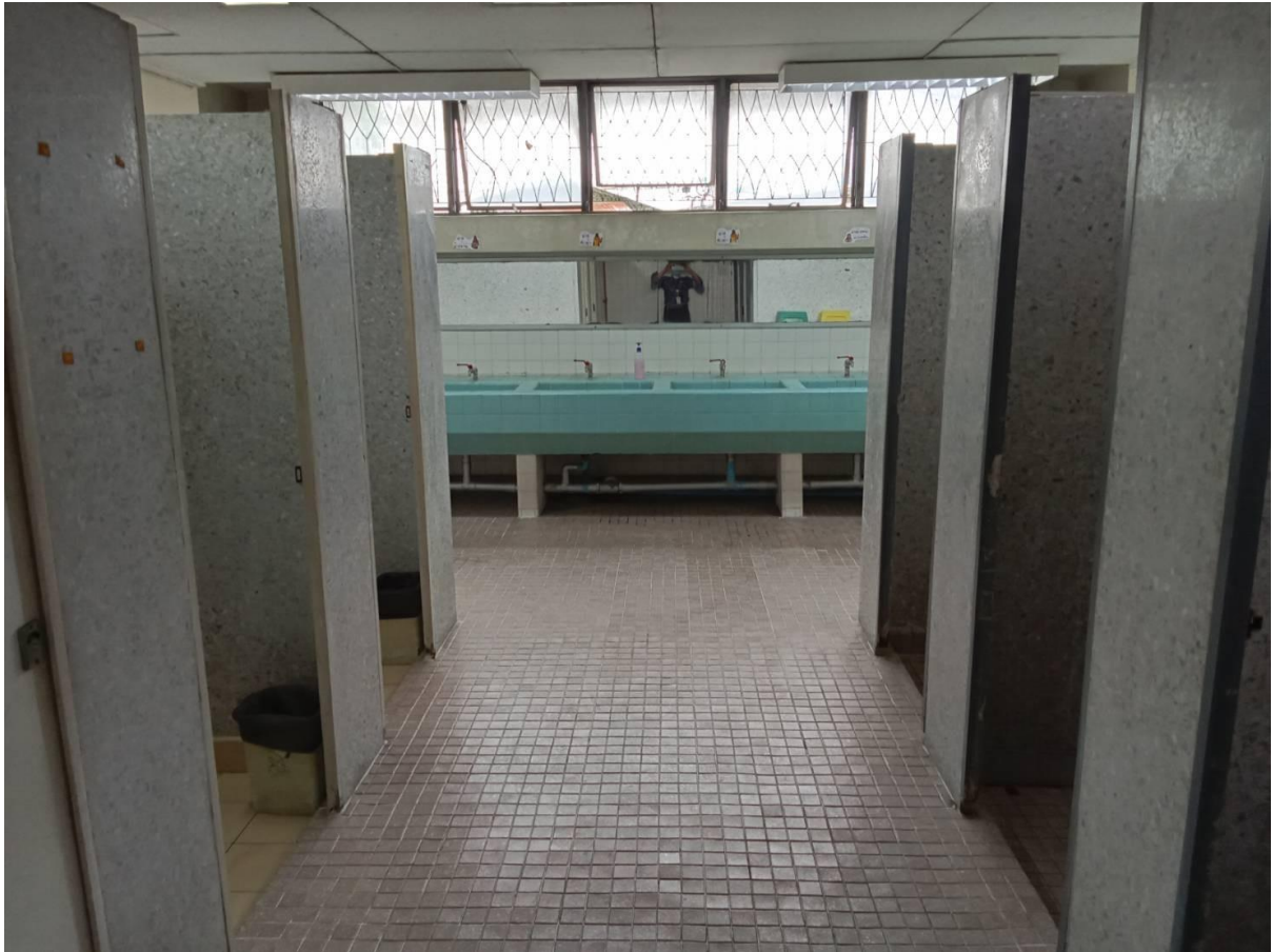
ภาพห้องน้ำ ห้องส้วมโถปัสสาวะ และอ่างล้างมือ หอพักคณะพยาบาลศาสตร์ บางขุนนนท์