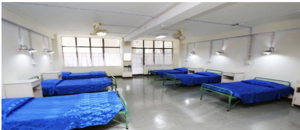
ห้องพักสำหรับนักศึกษาและบุคลากรคณะพยาบาลศาสตร์ บางขุนนนท์ ห้องพักสำหรับนักศึกษาที่เจ็บป่วย คณะพยาบาลศาสตร์ บางขุนนนท์