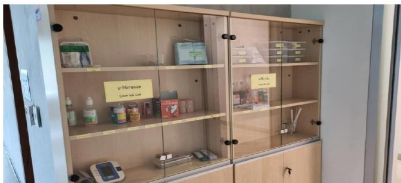
ห้องปฐมพยาบาล คณะพยาบาลศาสตร์ ศาลายา