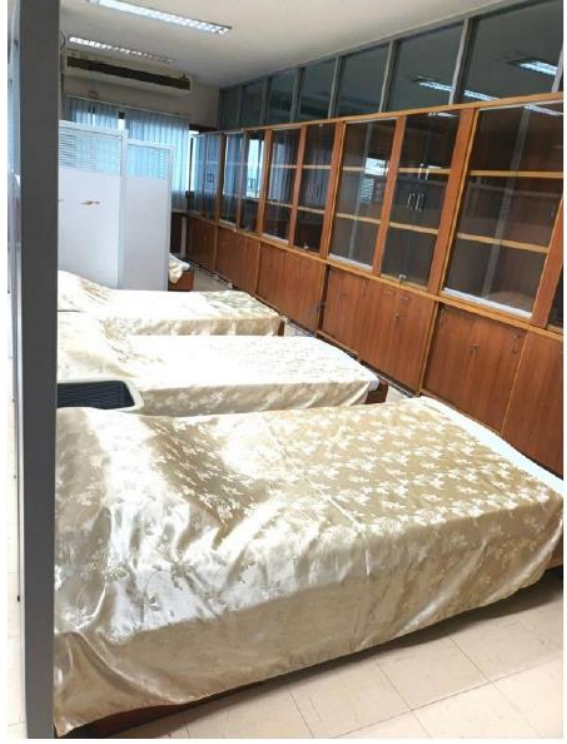
ห้องปฐมพยาบาล คณะพยาบาลศาสตร์ บางกอกน้อย