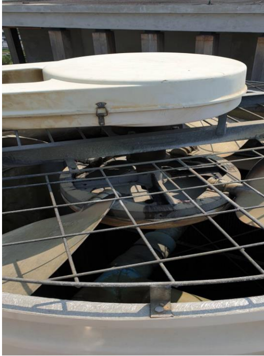
ฝาครอบชุดสายพาน