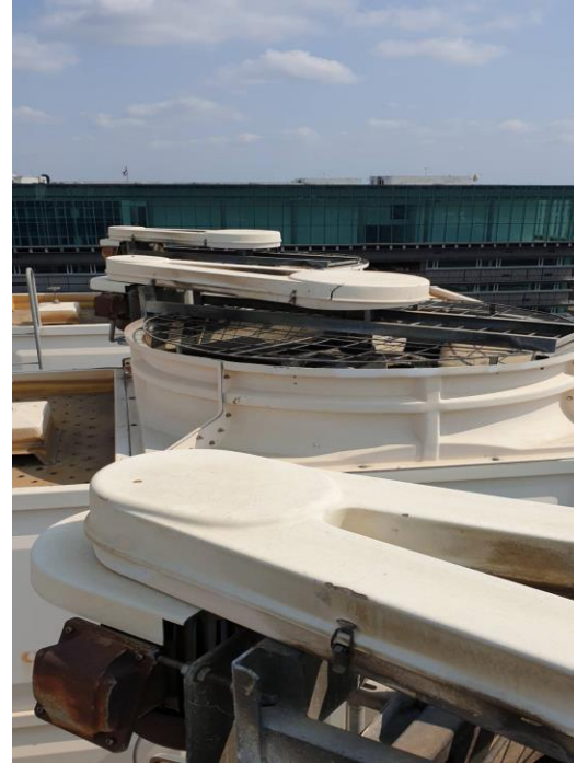
ฝาครอบชุดสายพาน