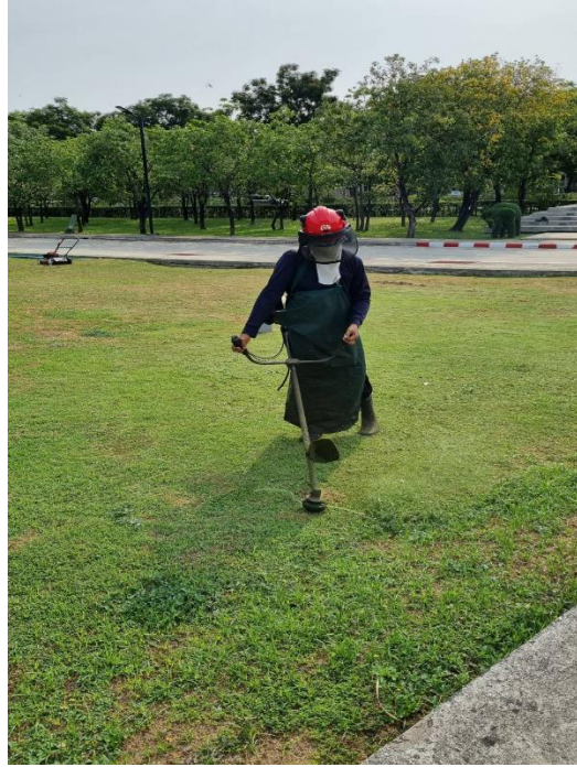
ชุดและอุปกรณ์ป้องกันอันตรายจากการตัดหญ้า