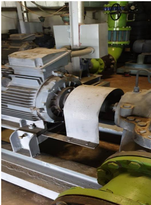
ฝาครอบจุดหมุนของเพลापัมน้ำ