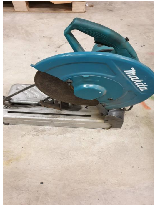
ฝาครอบอุปกรณ์ตัดเหล็ก