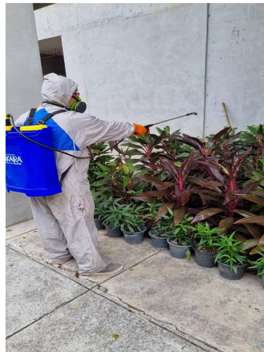
ชุดและอุปกรณ์ป้องกันอันตรายจากการฉีดพ่นยาฆ่าแมลง